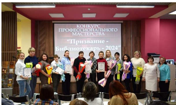
Конкурс профмастерства библиотекарей МКУК МЦБС в ЦМБ 24.10.2024↑

Фото по ссылке https://disk.yandex.ru/d/8_TWvG1JevaGuQ