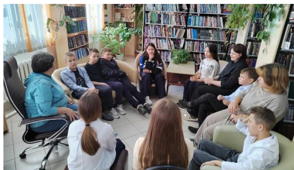
Урок-диспут «Что я вкладываю в понятие «чтение» в биб-ке № 28 п. Мирный, 09.09.2024 ↑