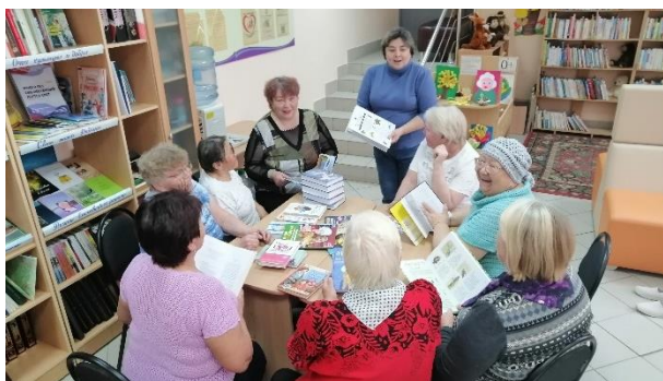
Беседа-предупреждение «Осторожно, мошенники!» в биб-ке № 28 п. Мирный 14.10.2024 ↑