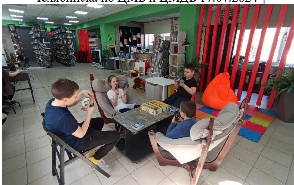
Клуб настольных игр в б-ке №36 п. Полетаево↑