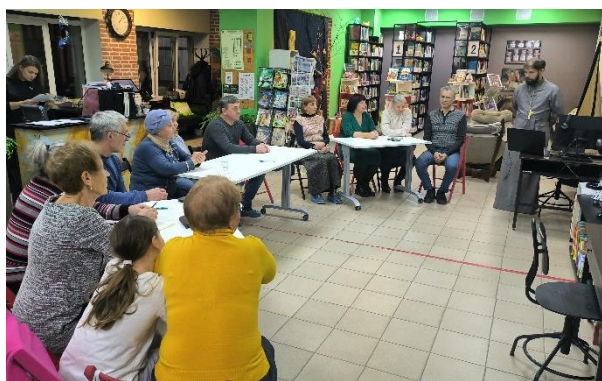
Квиз о семейных ценностях в б-ке п. Полетаево↑