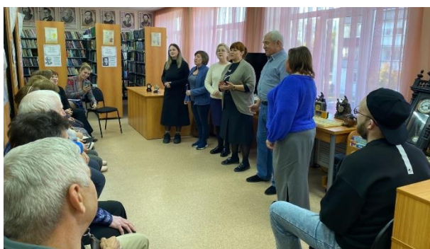
«Библиогостинная» в биб-ке № 27 п. Кременкуль, 27.09.2024↑