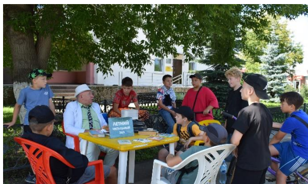
Летний читальный зал ЦМБ и ЦМДБ