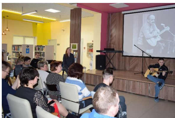
«Окуджава»: вечер поэзии в ЦМБ, 29.03.2024↑