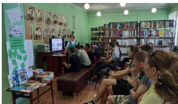
«Вся правда о вредных привычках» для СКШИ в биб-ке №22 п. Есаульский, 09.07.2024↑