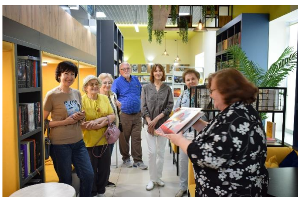
Экскурсия для ветеранов журналистики из Челябинска по ЦМБ и ЦМДБ 17.07.2024↑